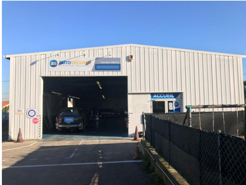
- Centre de contrôle technique automobile de Saint-Victoret -

Situation du TP : 2 nd semestre de 1 ère année BTS AMCR formatif ou sommatif. Durée : 2 fois 4h. Séance 1 (4h) : Lecture sujet 30 min Q1 à Q4 réalisation de 2 plats, 4 goussets et assemblage 1h30 Q5 1h pour les deux essais Q6 à Q7 1h calcul valeur moyenne et recherche des vérifications sur EC3 Séance 2 (4h) : Q8 à Q14 2h30 manipulations sur Excel pour trouver une solution Q15 à Q18 1h30 réalisation d'1 plat, 2 goussets, assemblage et essai