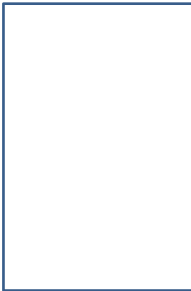
- Vue de l'éprouvette sur la machine de traction -

Répétez cette dernière opération pour les 3 éléments supplémentaires pour réaliser le deuxième essai.